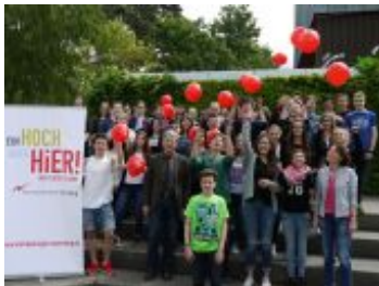
Die Schülerinnen und Schüler der Klassen 9a und 9b des Sigmund-Schuckert-Gymnasiums nehmen mit zwei Projekten am Schulwettbewerb teil.

Die Metropolregion Nürnberg bietet mit dem Schulwettbewerb "Unsere Metropolregion Nürnberg" eine Plattform, auf der sich Schülerinnen und Schüler mit ihrer Heimatregion auseinandersetzen können. Teilnehmen können alle Altersstufen und Schularten ab der 5. Klasse.