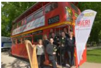
Das Metropolorchester nahm nach dem Festakt in der Orangerie den Geburtstags-Doppeldecker in Augenschein.

Das Jubiläum 10 Jahre Metropolregion Nürnberg soll übers Jahr an möglichst vielen Orten der Metropolregion gefeiert werden. Deshalb ist der rote Doppeldecker-Geburtstagsbus das ganze Jahr über auf seiner „Ein Hoch aufs Hier“-Tour unterwegs und macht auf Festen, Märkten oder Messen Station.